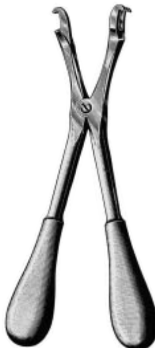
STILLE-HAGLUND 21.0140 28 cm