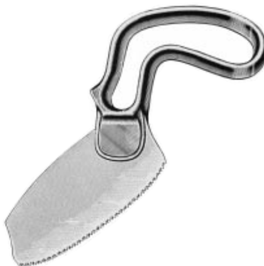
BERGMANN 21.0070 23 cm