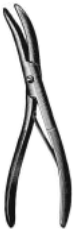
WOLFF 21.0100 18 cm

Verband- und Gipsscheren siehe Seiten 135 - 138 Bandage- and Plaster Scissors see pages 135 - 138 Ciseaux à pandements et à plâtre voir pages 135 - 138 Tijeras para vendajes y per yeso véase pag. 135 - 138 Forbici per bendaggi e per gesso vedi pag. 135 - 138