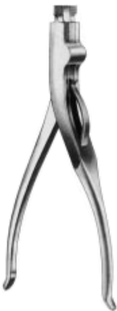
WALTON 21.0130 23 cm