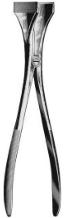
HENNING 21.0120 27 cm