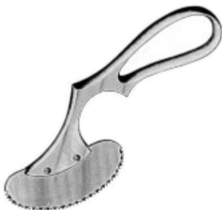
ENGEL 21.0060 16 cm